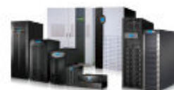
A Delta oferece uma linha completa de soluções de 600VA a 4.000kVA para atender à todas as suas necessidades de energia segura.

* A capacidade de potência pode ser ajustada de 160 para 150kVA através do painel