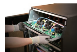
Arquitetura interior swap para rápida e fácil manutenção*