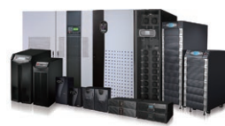
A Delta oferece uma gama completa de soluções em fornecimento de energia de 600 VA até 4000 kVA.