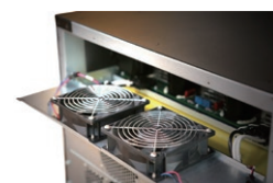
Ventilador redundante que melhora a confiabilidade do sistema