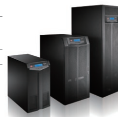
Alta performance das séries HPH UPS

Todas as especificações estão sujeitas a alterações sem aviso prévio.