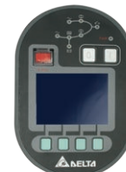
Controle e Painel Digital LCD

Todas as especificações estão sujeitas a alterações sem aviso prévio.